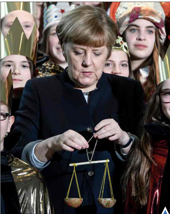
حضور انگلا مرکل، صدر اعظم آلمان در مراسم جشن سال نو میان کودکان

یک عضو یگان ضد تروریستی عراق مشغول تیراندازی به یک پهباد داعش در موصل