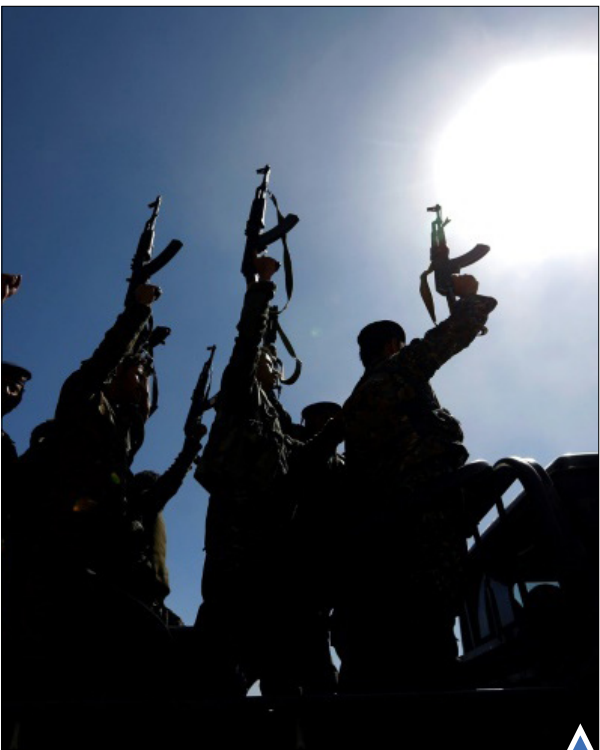
مبارزان حوثی در یمن.