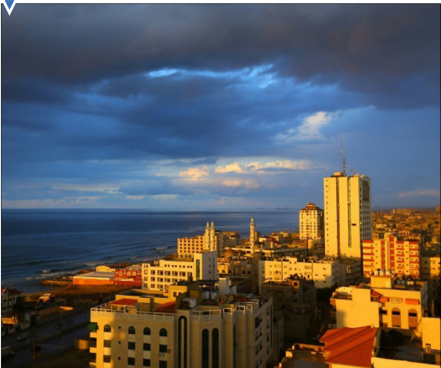
غروب آفتاب در شهر غزه.