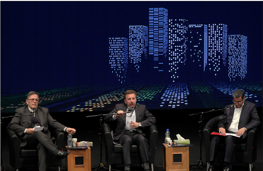
ششمین همایش بانکداری الکترونیک