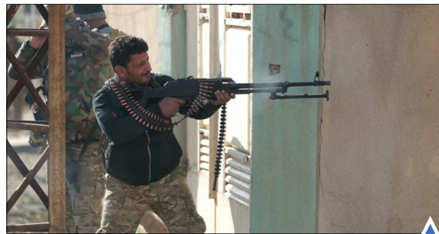
جنگ در شرق موصل کمک نیروی صلیب سرخ اسپانیا به مهاجر