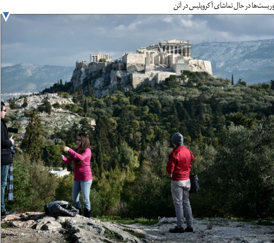
توریست‌ها در حال تماشای آکروپولیس در آتن