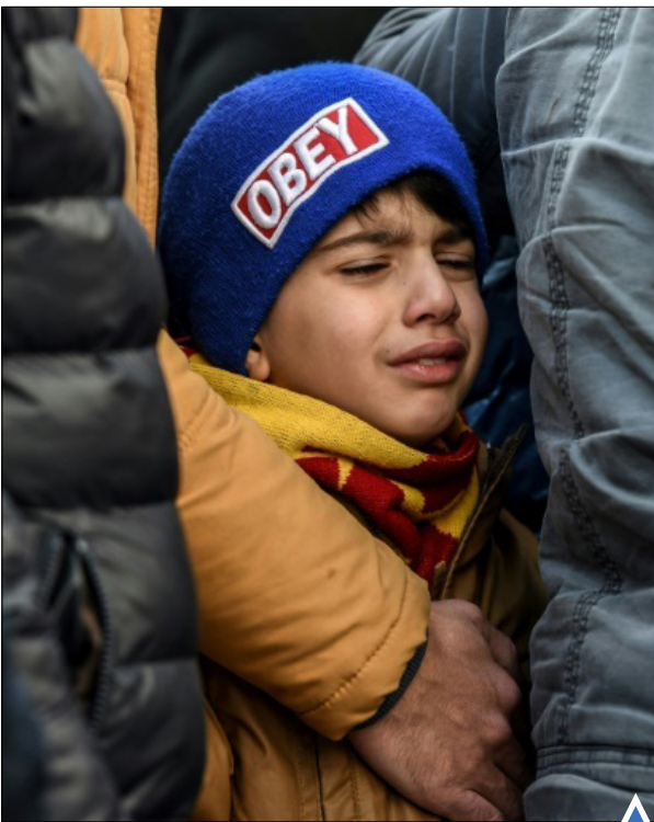
گریه برای قربانیان حمله به کلوب شبانه در استانبول