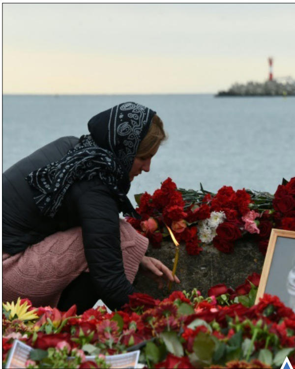
اهدای گل برای یکی از قربانیان سقوط هواپیمای روسی