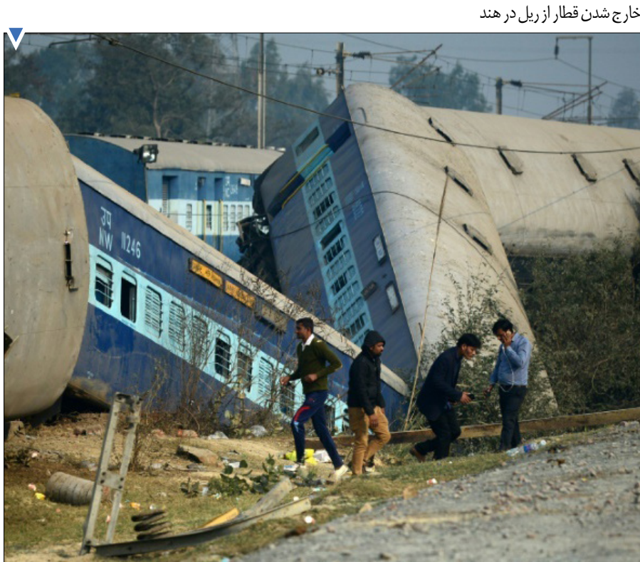
خارج شدن قطار از ریل در هند