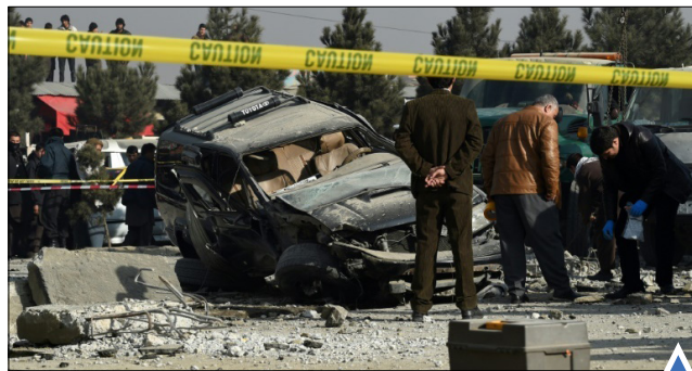
سوء قصد به جان نماینده مجلس افغانستان در کابل