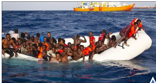
مهاجرت با قایق‌های بادی در دریای مدیترانه بیش از ۴۰۰ نفر در زلزله ۷٫۸ ریشتری آکوادور جان باختند.