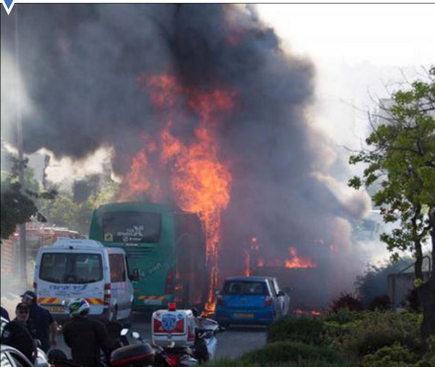
انفجار اتوبوس در فلسطین جان دو نفر را گرفت.