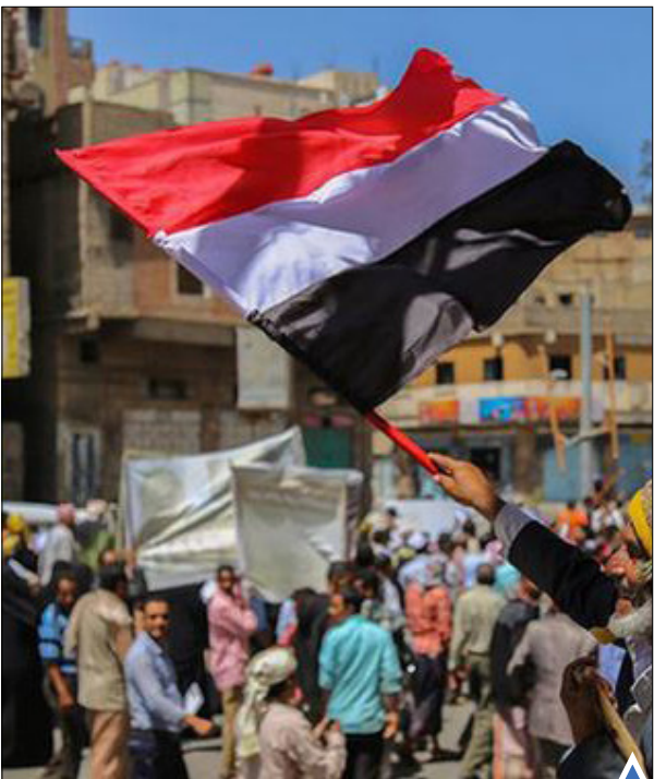
مردیمنی در اعتراضات مردمی علیه جنگ جاری پرچم یمن را تکان می‌دهد.