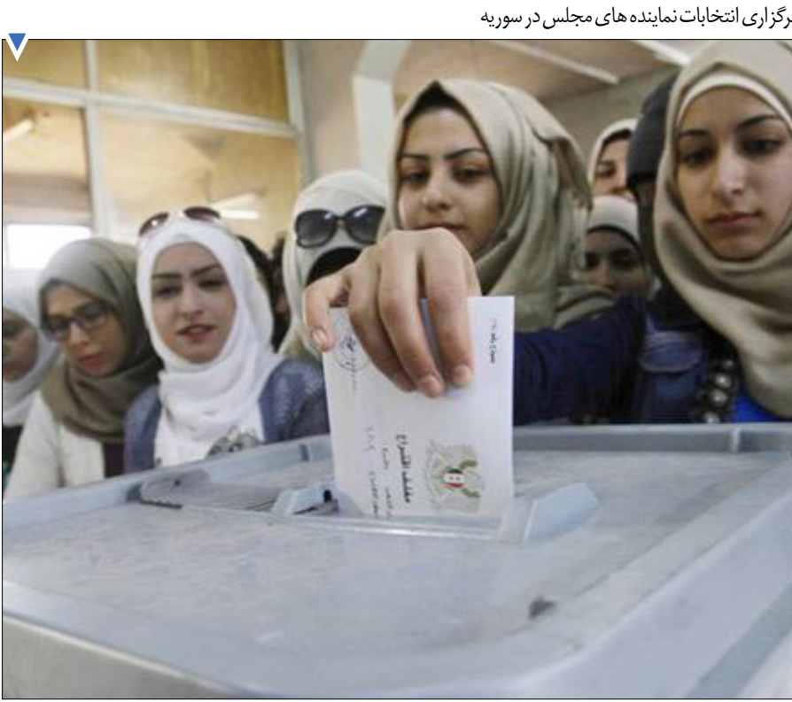
برگزاری انتخابات نماینده‌های مجلس در سوریه