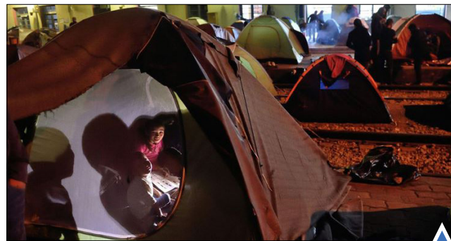
چادرهای مهاجران در مرز یونان - مقدونیه