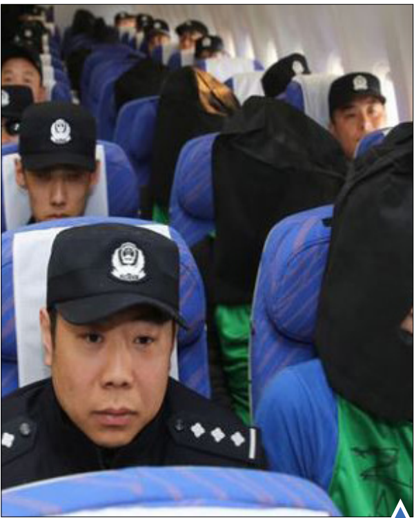
انتقال ۴۵ مظنون تخلف مخابراتی به چین

مسائل برجام و چند و چون اجرای آن در دیدارهای دو جانبه به حاشیه رفته و بیشتر در خصوص نگرانی‌های منطقه‌ای و همکاری‌های همه جانبه سخن گفته می‌شود. نگاه گذرا به دستاوردهای سفر هیأت ایتالیایی به ایران، زمان سفر و نوع قرارداد‌های منعقد شده میان طرفین و همچنین سفر قریب الوقوع مسئول سیاست خارجی اتحادیه اروپا به خوبی نشان می‌دهد که دولت‌های اروپایی در صدد ارسال پیام واضحی به شبکه بانکی این کشورها هستند. پیامی با این مضمون مشخص که در فضای پسا برجام، روابط اقتصادی میان ایران و این کشورها وارد مرحله‌ای تازه شده است که در آن نشانی از ریسک بالای سرمایه‌گذاری وجود نخواهد داشت. شیوه قرارداد‌های منعقد شده میان ایران و ایتالیا و پیش‌تر از آن میان ایران فرانسه به خوبی نشان داد که دولت اروپایی نسبت به ایجاد گشایش در روابط اقتصادی با ایران مصمم بوده و