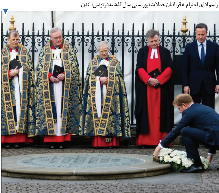
مراسم ادای احترام به قربانیان حملات تروریستی سال گذشته در تونس؛ لندن