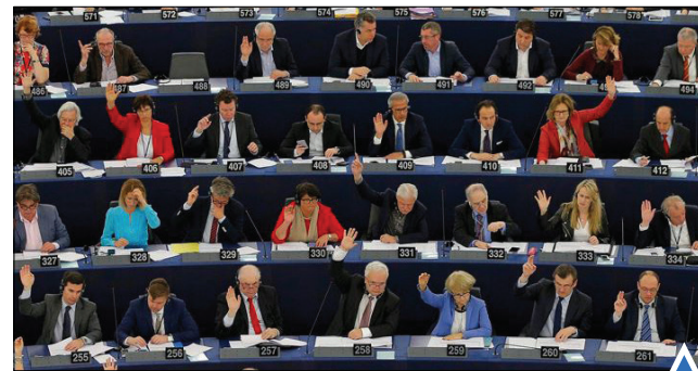
جلسه رأی‌گیری پارلمان اروپا؛