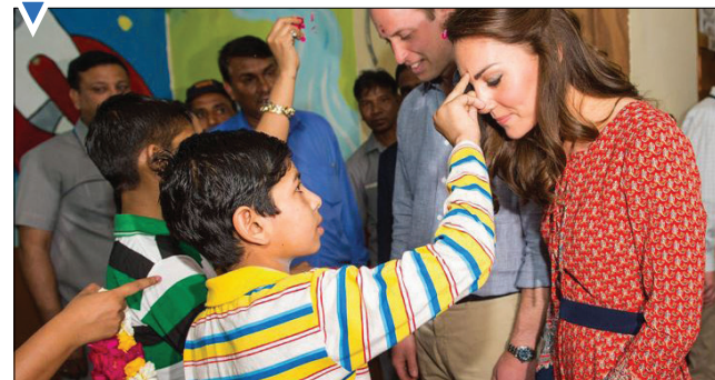
استراسبورگ، فرانسه شاهزاده ویلیام و همسرش کیت میدلتون در مراسم خیریه برای کودکان بی‌خانمان؛ دهلی نو