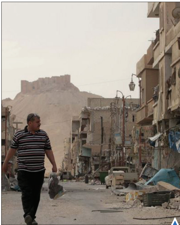
زندگی در پالمیرا، سوریه