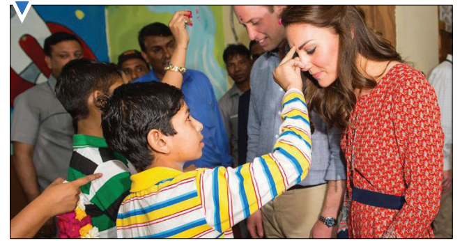
مراسم خیریه برای کودکان بی‌خانمان؛ دهلی نو