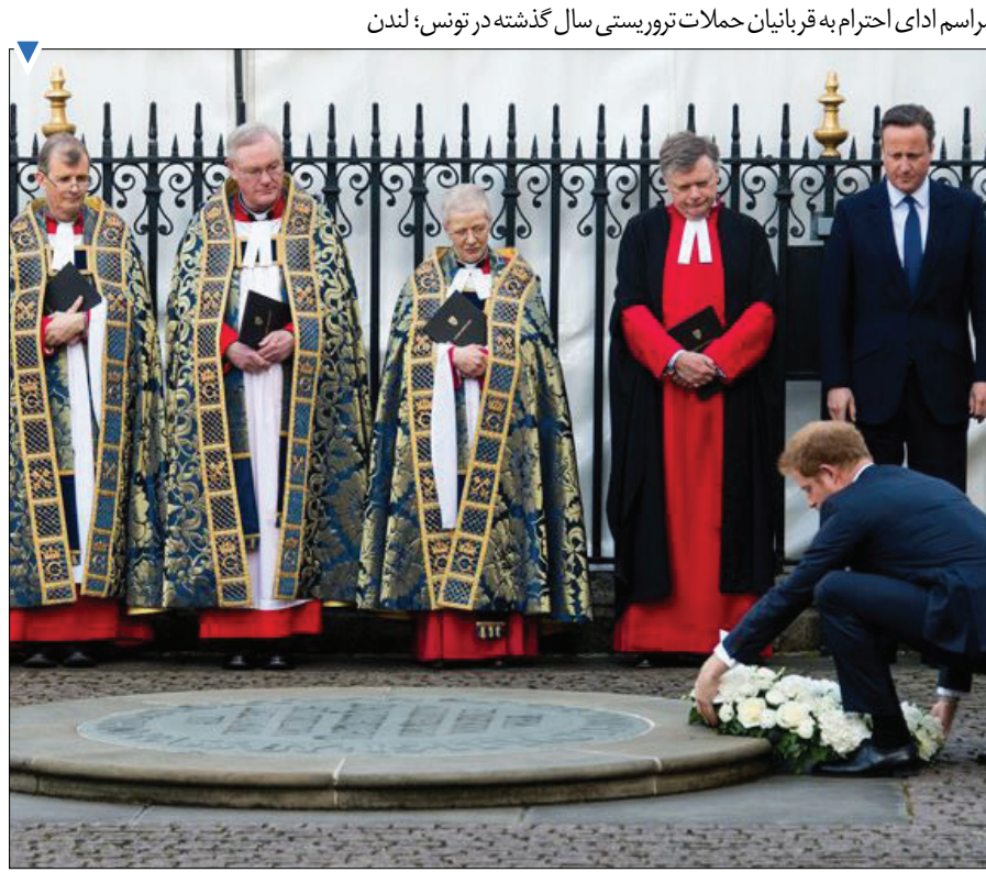
مراسم ادای احترام به قربانیان حملات تروریستی سال گذشته در تونس؛ لندن