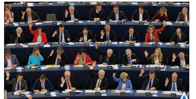
جلسه رأی‌گیری پارلمان اروپا؛