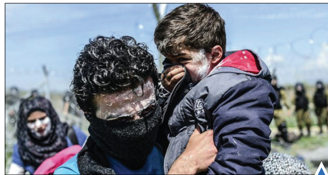
مخاطبات در برابر گاز اشک‌آور پلیس با خمیردندان در جریان اعتراض به بازتشدن مرز در یونان