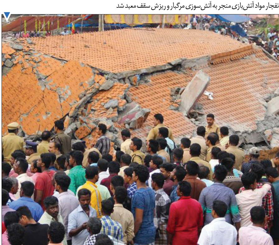
انفجار مواد آتش‌بازی منجر به آتش‌سوزی مرگبار و ریزش سقف معبد شد