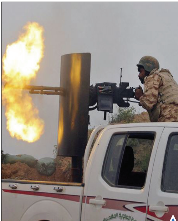
نیروهای امنیتی عراق در تلاش برای به دست آوردن دوباره کنترل شهر کرکوک