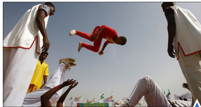
شکار لحظه هنگام اجرای حرکات آکروبات در جریان بازدید رئیس‌جمهور سوئدان. پیشاور پاکستان.