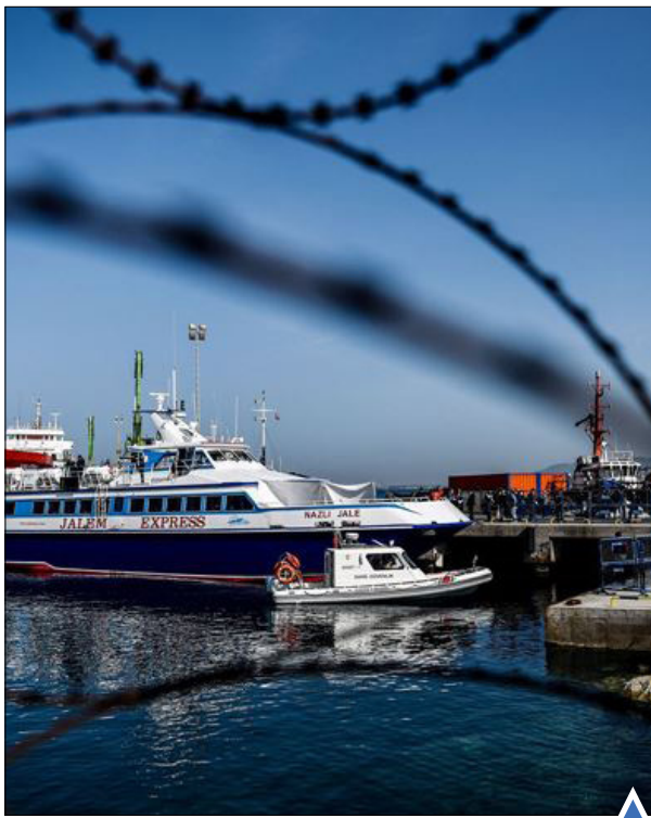
کشتی بازرگاندان مهاجران از یونان به ترکیه؛ از میر.

روزنامه «وال استریت ژورنال» امروز در گزارشی در این زمینه اشاره کرد که بحران ایجاد شده در منطقه قره‌باغ، طی روز گذشته نیز ادامه پیدا کرد و در جریان آن، نیروهای ارمنی مستقر در این منطقه با نیروهای نظامی جمهوری آذربایجان تبادل آتش داشتند. با وجود اینکه جمهوری آذربایجان روز یکشنبه اعلام کرد که به‌طور یکجانبه آتش‌بس برقرار می‌کند، اما درگیری‌ها عملاً متوقف نشد و شب گذشته نیز در طول «خط تماس» (مرزی که در پی آتش‌بس سال ۱۹۹۴ در این منطقه مورد توافق قرار گرفته) صدای گلوله و انفجار به گوش می‌رسید. در این میان، مقامات ارمنی، ترکیه را به حمایت از جمهوری آذربایجان متهم می‌کنند. دیوید بابایان، سخنگوی ریاست منطقه خودمختار قره‌باغ، ضمن بیان این مطلب، اظهار داشته: «آذربایجان نمی‌تواند این گونه اقدامات را به تهنایی انجام دهد». این موضع پس از آن بیان می‌شود که رجب طیب اردوغان، رئیس‌جمهور ترکیه، روز گذشته اشاره کرد کشورش تاکنون از تلاش‌های آذربایجان برای به دست گرفتن مجدد کنترل قره‌باغ حمایت کرده و پس از این نیز چنین خواهد کرد. اردوغان در این زمینه گفت: «بی‌تردید، قره‌باغ روزی به مالک برحق خود باز خواهد گشت و آذربایجانی خواهد شد. خشونت در قره‌باغ و قتل عامی که آنجا در حال وقوع است، قلب‌های ما در ترکیه را نیز آتش می‌زند». گفتنی است پس از گذشت سه روز، هنوز هم آمار دقیقی از تلفات درگیری‌ها در قره‌باغ وجود نداشته و اطلاعات طرفین در این زمینه متناقض است.