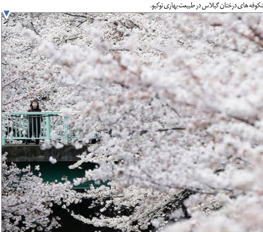
شکوفه‌های درختان گیلاس در طبیعت بهاری توکیو.