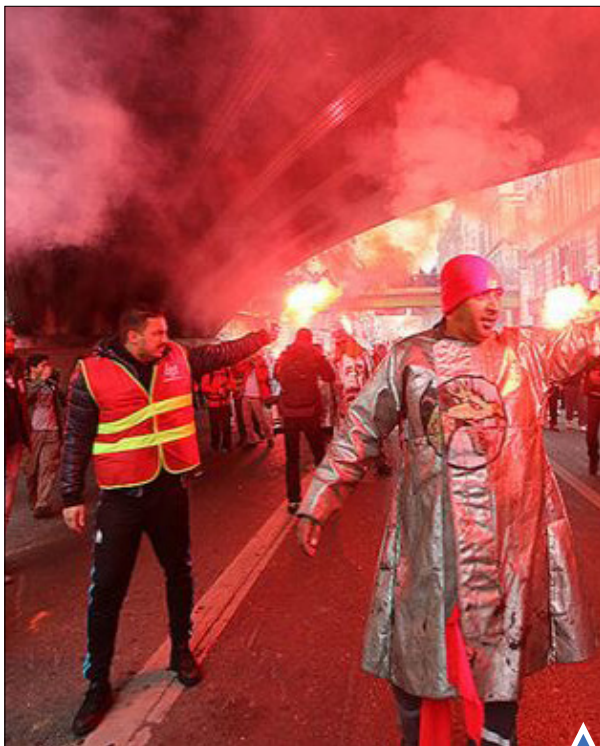
اعتراض کارگران کارخانه فولاد در فرانسه.