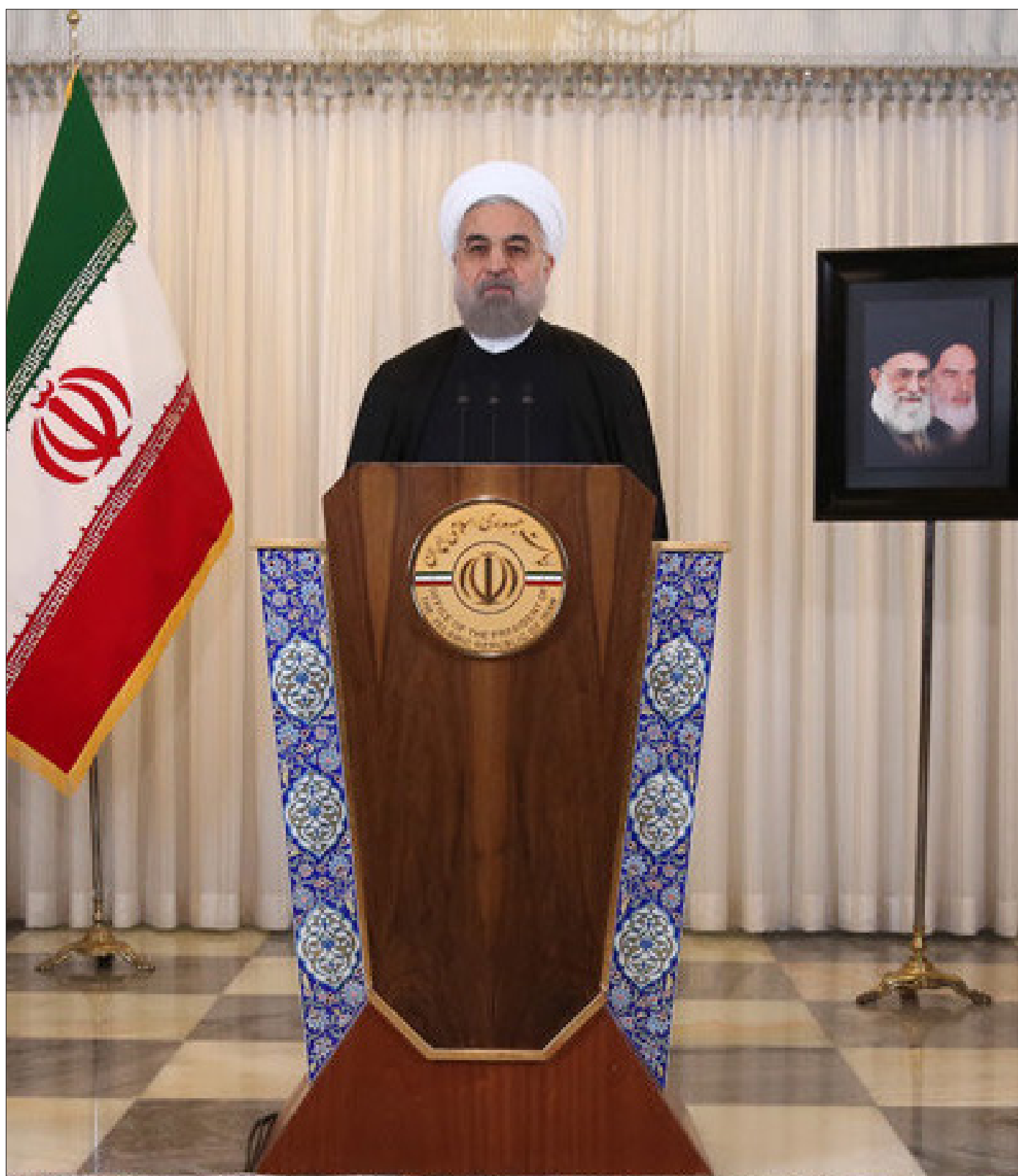
رییس جمهور: به ملت ایران تبریک می‌گویم