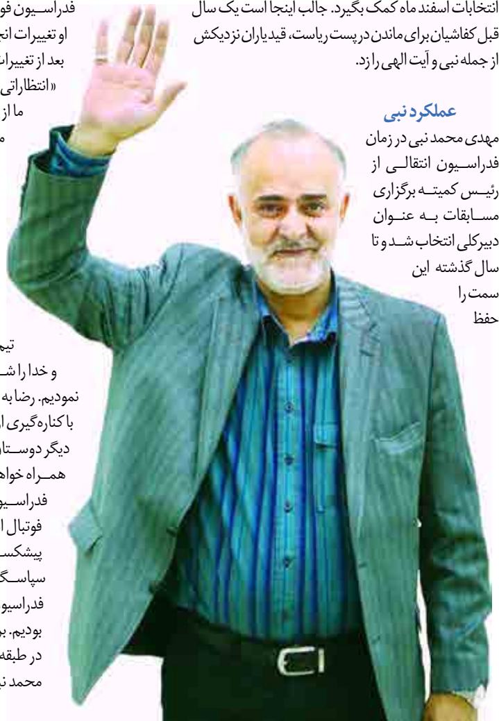
خبر آخر تیترو