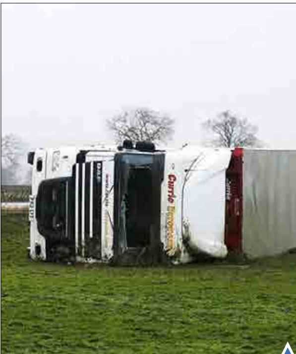
وقوع طوفان دزموند در شمال انگلیس، موجب تخلیه خانه‌ها، آب گرفتگی معابر عمومی و مرگ یک تن شد.

مهاجرانی که هفته هاست در مرز مقدونیه و یونان سرگردان مانده اند، در تلاش برای عبور از مرز با پلیس یونان درگیر شدند.