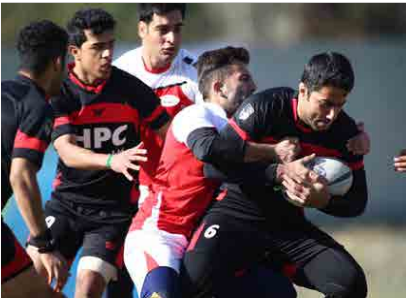
دیدار تیم‌های راگی شهرداری تبریز و کنگره ۶۰ در چارچوب لیگ برتر سونز، در ورزشگاه آزادی تهران برگزار شد.