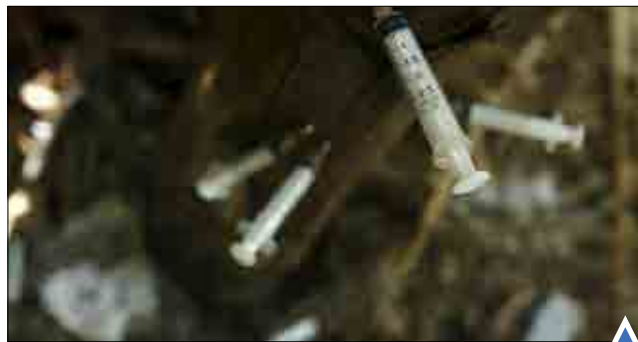
سنگ‌های مصرف شده هروئین روی درخت در ویتنام. سلفی در ارتفاع ۲۲۰ متری در بالای برج «چین مانو» در شانگهای چین.