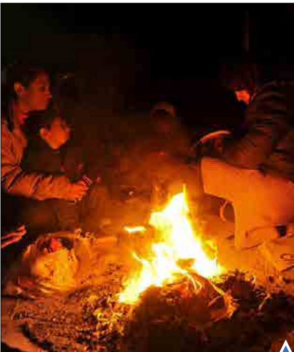
پناهجویان در حالیکه در انتظار عبور از مرز یونان هستند، به دور آتش حلقه زده و خود را گرم می‌کنند.