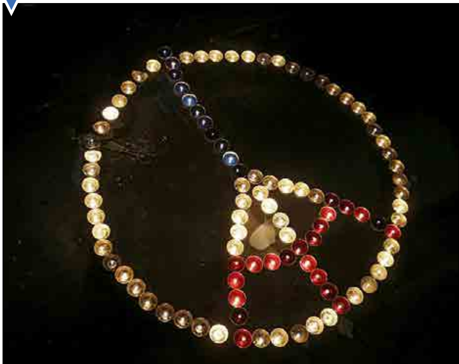
نثار گل و روشن کردن شمع در میدان جمهوری پایتخت فرانسه به احترام قربانیان حادثه تروریستی هفته گذشته از سوی شهروندان.