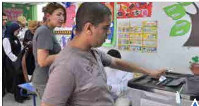
برگزاری انتخابات پارلمانی مصر در غیاب احزاب قدرتمند مخالف. بالاترین سطح هشدار امنیتی در بروکسل روز یکشنبه هم تمدید شد.