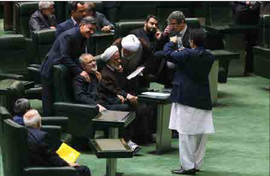
در حاشیه حضور ظریف