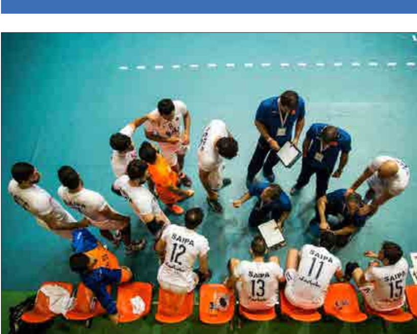
دیدار تیم‌های والیبالی