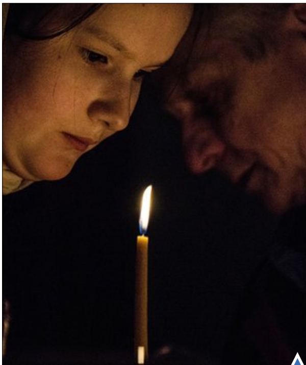
مردم قازان روسیه برای یادبود قربانیان سقوط هواپیما در شبه جزیره سینا شمع روشن کردند.

خانواده‌های اهل کره جنوبی، پس از چند دهه دوری، اجازه دارند به مدت ۷۲ ساعت با خویشاوندان خود در کره شمالی دیدار کنند.