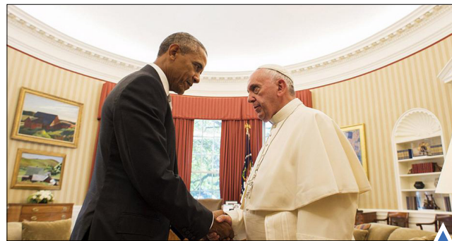
باراک اوباما، در دیدار رسمی پاپ از کاخ سفید به او خوشامد می‌گوید. دری دو انفجار انتحاری در مسجد جامع «البیلی» واقع در صنعا، دهان‌مازگار کشته شدند.