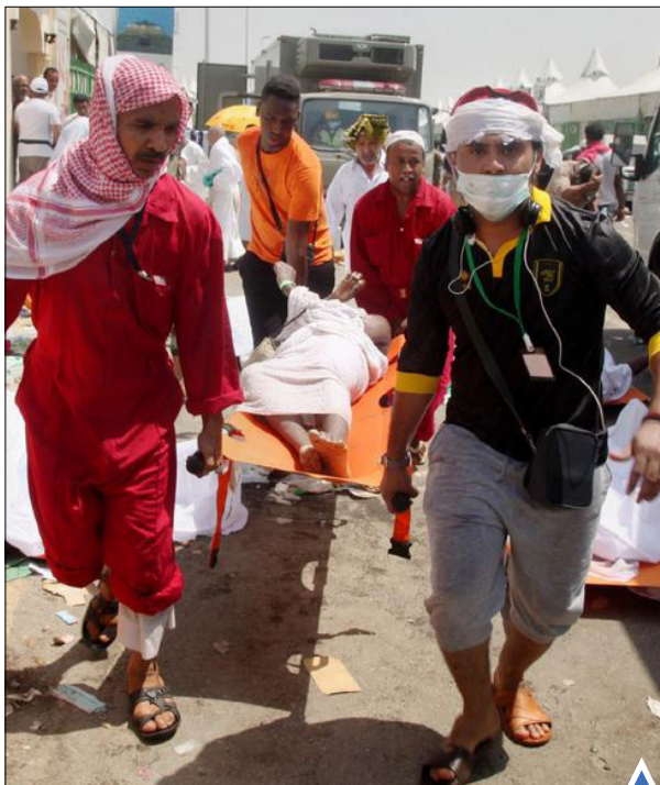
۱۳۰۰ حاجی در ازدحام «منا» کشته و حدود ۲۰۰۰ نفر زخمی شدند، ۱۳۳ کشته از زائران ایران نیز تا روز شنبه چهارم مهر گزارش شده است.

هزاران بنگلادشی می‌خواهند برای جشن عید قربان به شهرهایشان بازگردند. هر ساله مسلمانان جهان عید قربان را جشن می‌گیرند.