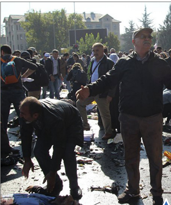
انفجار دو بمب، روز شنبه در یکی از خیابان‌های اصلی «انکارا» پایتخت ترکیه ده‌ها کشته و زخمی برجای گذاشت.

در حمله نظامیان صهیونیست به اردوگاه شغفاط در شرق بیت المقدس، یک جوان فلسطینی به شهادت رسیده است.