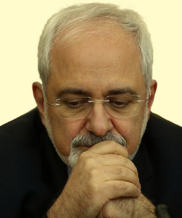
محمدجواد ظریف در نشست خبری مشترک با برت کوننداس وزیر امور خارجه هلند با تاکید بر این موضوع اظهار کرد که نکته‌ای که جامعه جهانی و اتحادیه اروپایی باید به آن توجه داشته باشد اجرای درست و جدی برجام است و این می‌تواند بهترین ضمانت در بقای توافق باشد. وی تصریح کرد که اگر آن‌ها به این توافق به عنوان یک دستاورد در عرصه دیپلماسی نگاه کنند، همه تلاش‌ها و اقدامات در این زمینه رو به جلو و مثبت خواهد بود و زمینه برای اجرای شدن آن هر چه بیشتر فراهم می‌شود.

اینکه ما تصور کنیم شورای نگهبان نسبت به گرایش‌ی که در جامعه از مقبولیت بالایی برخوردار است بد عمل خواهد کرد، به نظر درست نیست، ولی ممکن است روی افراد درمورد بحث‌های سال ۸۸ نظراتی داده شود و به نظر می‌رسد صرف اصلاح‌طلبی به منزله رد صلاحیت افراد نمی‌تواند باشد.