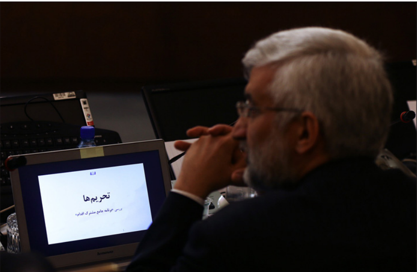
جلسه امروز (یکشنبه