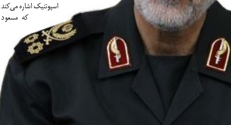
اسپوتنیک اشاره می‌کند که مسعود

محبوب‌ترین سرداران ایرانی نه تنها در نزد مردم ایران، بلکه در خاورمیانه است. وی در زمان جنگ عراق علیه ایران در جبهه‌های جنگ شجاعت‌های فراوانی از خود نشان داده و در شرق ایران با گروه‌های تروریستی و قاچاقچیان مواد مخدر هم مبارزه و جانفشانی‌های زیادی کرده است. این منبع خبری روس در بخش دیگری از گزارش خود نوشت: «متأسفانه بدعت جدیدی توسط آمریکا گذاشته شده که هر کس به هر دلیل با سیاست‌های این کشور مخالفت کند، در لیست سیاه قرار می‌گیرد و حتی اخیراً سازمان ملل را هم وادار می‌سازد این افراد را تحریم کند. سیاست‌هایی که تماماً در اختیار لابی‌های صهیونیستی و کارتل‌های ثروت در این کشور است و نه بر اساس منافع ملت آمریکا». این خبرگزاری معتقد است اگر آمریکا و همپیمانانش حق دارند برای حفاظت از منافع خود هر جا که اراده کنند دخالت کنند، پس ایران و دیگر کشورها هم حق دارند برای حفاظت از منافع خود هرگونه تدبیری را که صلاح می‌دانند، اتخاذ کنند.