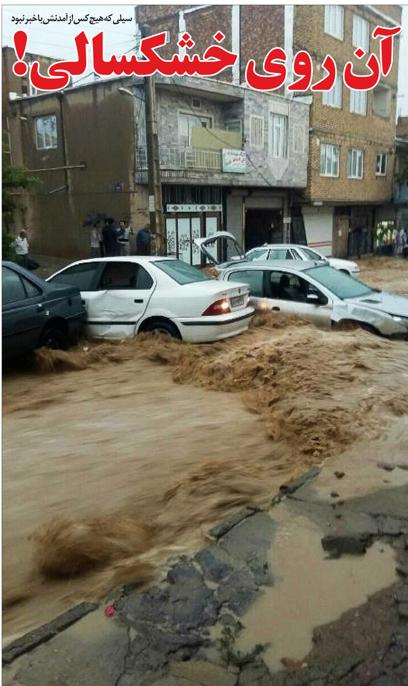
سیلی که هیچ‌کس از آمدنش باخبر نبود