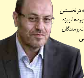
وزیر دفاع و پشتیبانی نیروهای مسلح

وی بر نقش رئیس‌جمهور در حل مساله هسته‌ای خاطرنشان کرد و افزود: ابتدای شروع مذاکرات هیچ چیز مشخص نبود به همین دلیل نیاز بود تا یک نفر مسئولیت این موضوع را قبول کند و رئیس‌جمهور با شجاعت این مسئولیت را قبول کرد.