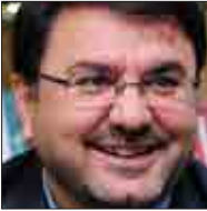
نایب رییس فراکسیون اصولگرایان

ولایت گفت: با تدابیر شوروی نگهبان در بررسی و تایید صلاحیت کاندیداهای دهمین دوره انتخابات مجلس شورای اسلامی و پنجمین دوره خبرگان رهبری با حضور عالی و رای بسیار بالای مردم دشمنان نظام و انقلاب