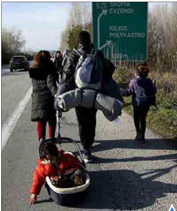
پناهجوی بینوا در امتداد راهی طولانی به همراه خانواده اش در بزرگراهی در نزدیکی پولی کاسترو در یونان.

در شانگهای چین 'کادیلاک سی تی' را در تگ ماهی به نمایش گذاشتند. سازندگان این خودرو با این روش نمادین سعی کردند نشان دهد که استانداردهای زیست محیطی را رعایت می‌کنند.