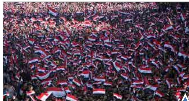
مردم عراق در تظاهراتی در میدان تحریر بغداد خواستار اصلاحات دولت شدند.

هوای سرد و زمستانی این روزهای مسکو، پایتخت روسیه.