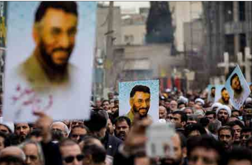
مراسم تشییع و تدفین