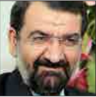
آیت‌الله طبری در مراسم تشییع

دبیر مجمع تشخیص مصلحت نظام با تاکید بر اینکه آیت‌الله واعظ طبریسی جزو استوانه‌های انقلاب و نظام هستند، گفت: من از مردم خوبمان می‌خواهم که برای ایشان دعا کنند و از حضرت امام رضا (ع) بخواهند که به این خادم و پاسدار حریمشان، شفای کامل عنایت فرمایند.محسن رضایی پس از عبادت از آیت‌الله واعظ طبری در بیمارستان امام رضا (ع) مشبهد مقدس، گفت: ما از درگاه خداوند متعال آرزو می‌کنیم که سلامتی کامل ایشان به زودی بازگردد و همچنان به خدمت در عرصه‌های مختلف مشغول باشند.وی هم‌چنین به روایت خاطره‌ای از دوران دفاع مقدس پرداخت و اظهار کرد: در زمان اجرای عملیات والفجر ۸، ما از ایشان تقاضا کردیم که پرچم حضرت رضا (ع) را در اختیارمان قرار دهند.