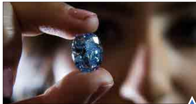
الماس آبی ۱۰۰۱۰ قیراطی در خانه حراج ساتبی لندن.