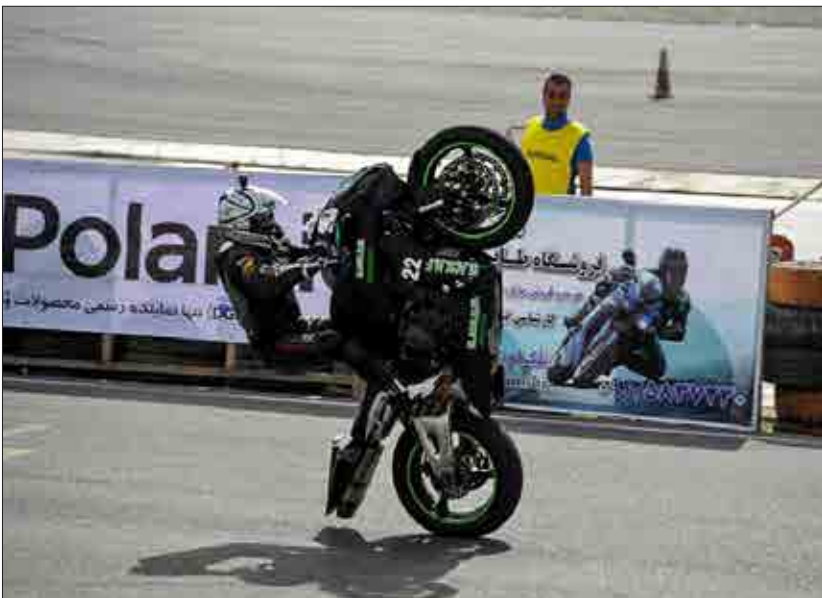
آخرین دوره مسابقات کشوری موتورسواری ریس در سال نود و چهار در پیست اومیلیرانی و موتورسواری آزادی واقع در ضلع غربی مجموعه ورزشی آزادی برگزار شد.