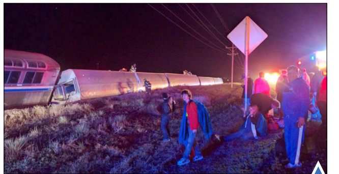
مسافران در نزدیکی داج سیتی کانزاس؛ پس از آنکه قطار لس آنجلس به شیکاگو از خط خارج شد!