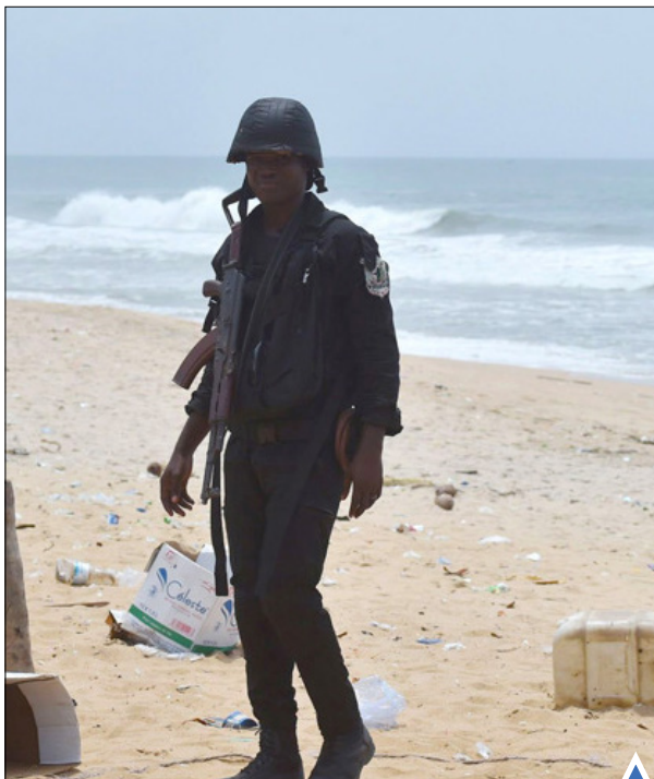
گشت‌زنی سربازان ساحل عاج پس از حمله مرگبار نیروهای القاعده و کشته شدن ۱۴ غیرنظامی و ۲ سرباز.

تجمع معترضان پیش از طلوع آفتاب مقابل کلیسا در دانشگاه خصوصی در نیوجرسی؛ پیش از برنامه تبلیغاتی دونالد ترامپ.