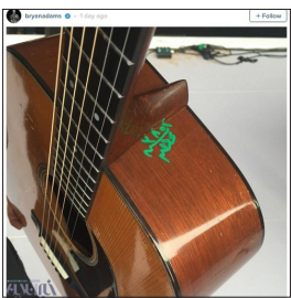
گیتار گمرک فرودگاه

مصر نوشت: «گرافیتی گمرک فرودگاه روی گیتار مارتین دی-۱۸ سال ۱۹۵۷ من». آدم‌آمز در این باره گفت که از آغاز با وارد کردن تجهیزات به مصر با مشکل روبه‌رو بوده‌اند و در نهایت وقتی وسایل خود را تحویل می‌گیرند، متوجه می‌شوند که تمام آن‌ها علامت‌گذاری شده‌اند. او در ادامه گفت که کسی به‌خاطر این کار از او عذرخواهی نکرده است. یکی از مسئولان گمرک مصر در این رابطه گفت تمام تجهیزات با شماره سریال نشانه‌گذاری می‌شوند، اما این کار را با برچسب انجام می‌دهند نه با مازیک. او احتمال می‌دهد شاید این خطا از جانب کارمندان گمرک نباشد. البته انتشار عکس گیتار برابان آدمز سبب شد بسیاری از مصری‌ها از رسانه‌های اجتماعی استفاده کرده و در این باره شوخی کنند. در یکی از این شوخی‌ها آمده است : «آیا برابان آدم‌آمز نمی‌داند که ما مساک توت‌آنخ‌آمون را با چسب وصله‌پینه کردیم؟ این خیلی عادی است اگر روی یک گیتار شصت ساله چیزی بنویسیم.» گفتنی است آدم‌آمز از شناخته‌شده‌ترین خواننده‌های راک جهان است و سال ۱۹۸۴ با آلبوم «بی‌باک» به شهرت جهانی رسید.