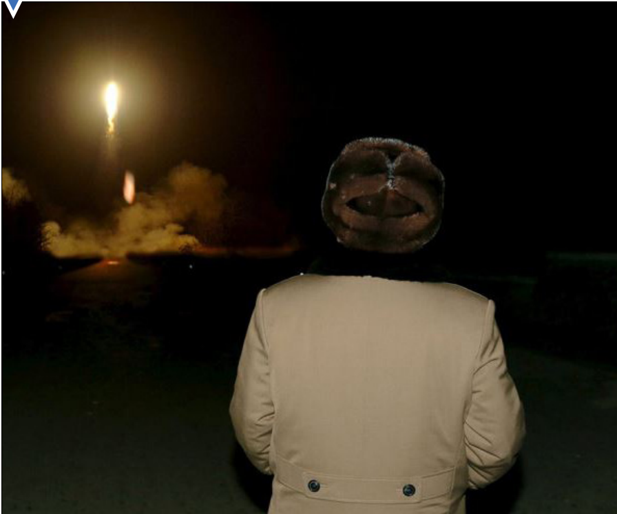
رهبر کره شمالی در حال تماشای پرتاب موشک.