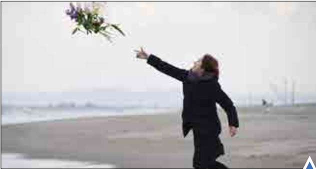
پرتاب گل به دریا به یاد قربانیان زلزله و سونامی سال ۲۰۱۱؛ توکیو.