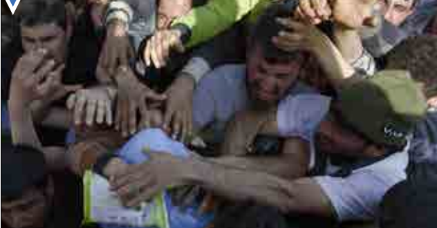
دریافت جبره غذایی توسط مهاجران؛ ایدومنی، یونان.