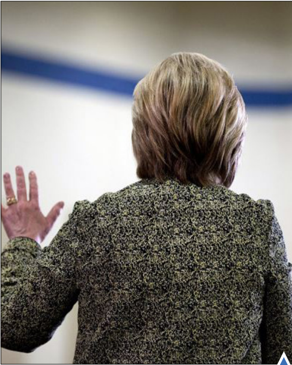
هیلاری کلینتون در طول مبارزات انتخاباتی؛ ایلینوی.