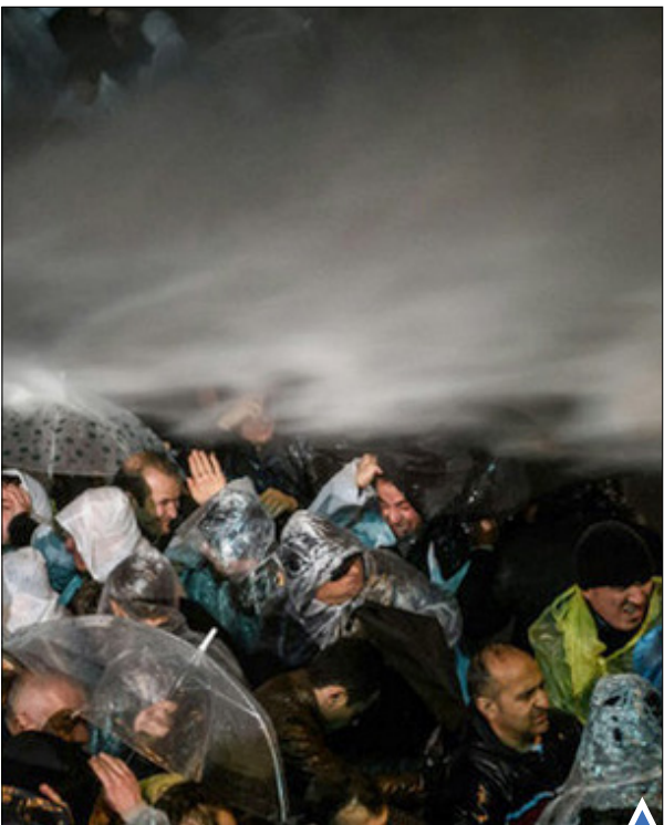
اعتراض طرفداران روزنامه زمان ترکیه به حمله پلیس به دفتر روزنامه.

از سوی دیگر، نتایج یک نظرسنجی نشان می‌دهد هیلاری کلینتون و برنی ساندرز، نامزدهای دموکرات انتخابات ریاست جمهوری آمریکا، می‌توانند دونالد ترامپ، نامزد پیش‌نشان جمهوری خواهان را در انتخابات ماه نوامبر شکست دهند. بنابر نتایج نظرسنجی «سی ان ان / او آر سی» که روز سه‌شنبه گذشته منتشر شد، کلینتون، نامزد پیش‌نشان دموکرات‌ها برای انتخابات ریاست جمهوری، در یک رقابت فرضی با کسب ۵۲ درصد آرا از ترامپ که ۴۴ درصد آرا را از آن خود کرده بود، جلوتر است. نتایج این نظرسنجی نشان داد که ساندرز نیز با اختلاف ۵۵ به ۴۳ درصد می‌تواند ترامپ را شکست دهد. بر اساس این نظرسنجی، هرچند ترامپ موفق شده فاصله خود را با ساندرز را کم کند، کلینتون با فاصله زیادی شانس بیشتری برای پیروز در انتخابات دارد. در همین نظر سنجی که سپتامبر سال گذشته نیز برگزار شد، ترامپ و کلینتون هر کدام از حمایت ۴۸ درصدی رأی دهندگان برخوردار بودند.