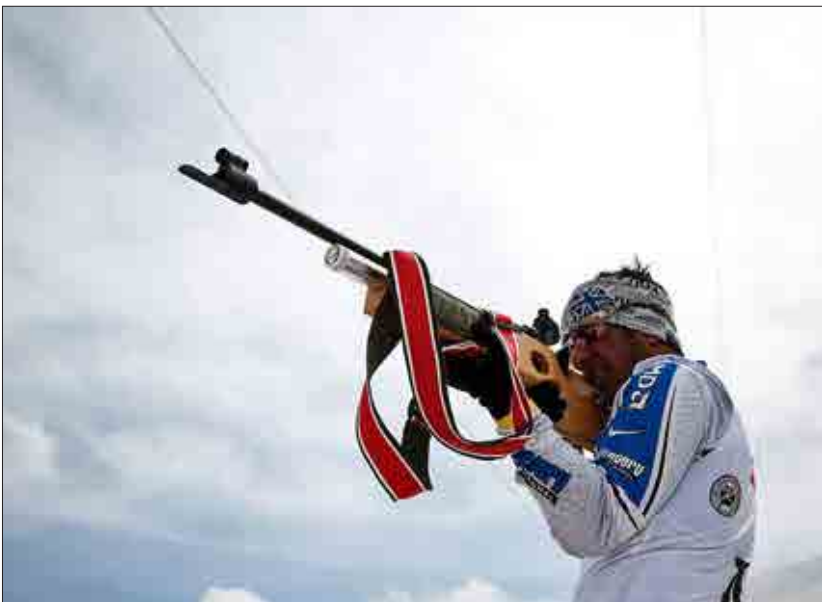
مسابقات اسکی قهرمانی