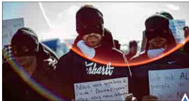
اعتراض مهاجران در کاله،

فرانسه. مراسم وارد کردن دو خواهر دوقلو به کلیسایی در نایروبی؛ بزرگترین زاغه در آفریقا.