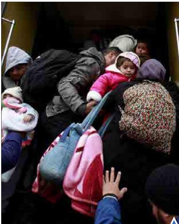
وضعیت اسفناک مهاجران در مرز صربستان در هوای سرد زمستانی.

اول فوریه، روزی بود که از سوی نیروهای دولتی سوریه و متحدان آنان برای آغاز عملیات گسترده در حومه شمالی حلب انتخاب شد. از آن تاریخ تاکنون، صدای شلیک توپخانه‌ها در مناطق شمالی حلب، سرتاسر این شهر را در بر گرفته و جنگنده‌های روسی نیز آسمان شهر را به تسخیر خود درآورده‌اند. اما این نبرد، با نمونه‌های پیشین متفاوت است. این، شدیدترین و خونین‌ترین نبردی است که تاکنون میان ارتش سوریه و معارضین در گرفته که گروه‌های مسلح را در قلب مناطقی که تحت کنترل دارند، هدف قرار داده و آن‌ها را کاملاً در موضع دفاعی قرار داده است. حومه شمالی حلب، پایگاه گروه موسوم به «ارتش آزاد سوریه» است که این گروه در ژوئیه ۲۰۱۲ از طریق همین پایگاه وارد شهر شد. اما از آنجا که در حال حاضر، چهار طرف اصلی در حلب فعال هستند، نقشه درگیری‌ها پیچیده‌تر شده است. این چهار گروه عبارتند از معارضین که بیشتر از ارتش آزاد تشکیل شده؛ دولت سوریه و متحانش؛ گروه موسوم به «نیروهای دموکراتیک سوری»؛ و گروه تروریستی داعش.