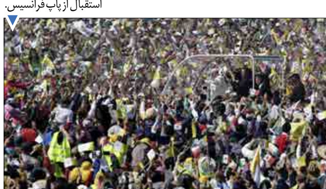
حضور پرشور مردم مکزیک در استقبال از پاپ فرانسیس.