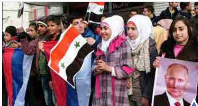
زندگی روزمره مردم جنگ زده شهرهای آزاد شده سوریه.