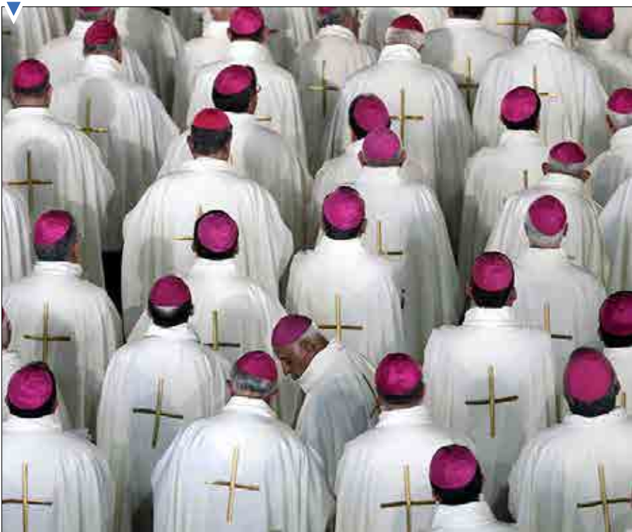
پاپ فرانچسکو، رهبر کاتولیک‌های جهان برای انجام مراسم مذهبی در کلیسای گوادالپ مکزیک حاضر شد.