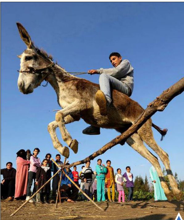
کشاورزان مصری در یکی از روستاهای کوچک این کشور اقدام به برگزاری مسابقه پرش از مانع با الاغ کرده‌اند.

یک شرکت روسی یک روش غیر معمول تخلیه خشم و استرس به مشتریان خود پیشنهاد می‌دهد. افراد خشمگین می‌توانند با پتک به جان وسیله‌های یک اتاق بیایند.