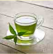
چای سبز در مقایسه با گروه پلاسبو

ایپي گالوکاتچين گالات (EGCG) است که بسیاری از خواص مفید چای سبز را به این ترکیب نسبت می دهند. در سال های اخیر مطالعات بسیاری در زمینه اثرات ضد چاقی چای سبز در سطح سلولی، حیوانی و انسانی انجام شده است.