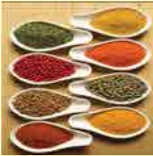
ادویه جاتی که به طور