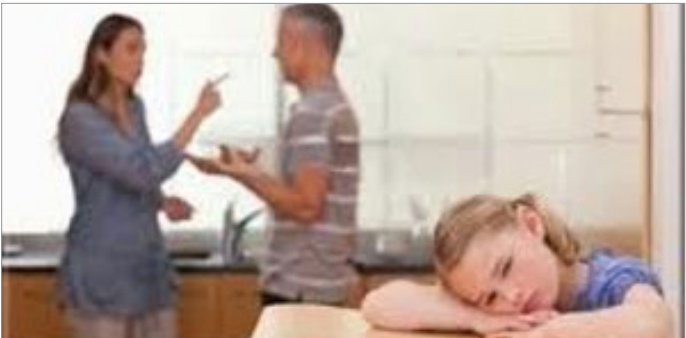
فرزندانی که در خانواده تنها هستند، همبازی ندارند و در نتیجه مشکلات رفتاری پیدا می‌کنند.

این روانشناس با تأکید بر این که لجبازی و خودخواهی یکی از بزرگترین مشکلات تک فرزندی است، افزود: کودکانی که در خانه تنها هستند و همبازی ندارند لجباز و خودخواه می‌شوند و در رابطه با پیدایش هر موضوع نسبت به والدین خود واکنش نشان می‌دهند.والدین باید بدانند تک فرزندی برای سلامت روحی و همچنین آینده فرزندانشان خطرآفرین است و آنها به تنهایی قادر نخواهند بود خلاءهای عاطفی به وجود آمده برای فرزندانشان را که ناشی از کمبود خواهر یا برادر و یک همبازی است را پر کنند.