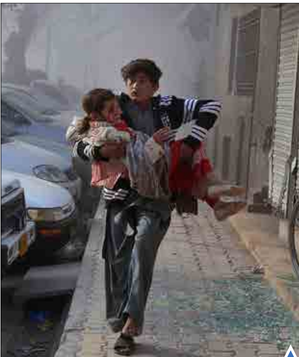
در پی وقوع انفجار بمب در نزدیکی پارک «لیاقت» ۹ نفر کشته و ۱۲ نفر زخمی شدند.

شهرهای مختلف اروپا و استرالیا نظیر پراگ، امستردام، درسدن، کاله، کانبرا و بیرمنگام شاهد تظاهرات گروه‌های راست افراطی علیه مهاجران و مسلمانان بود.