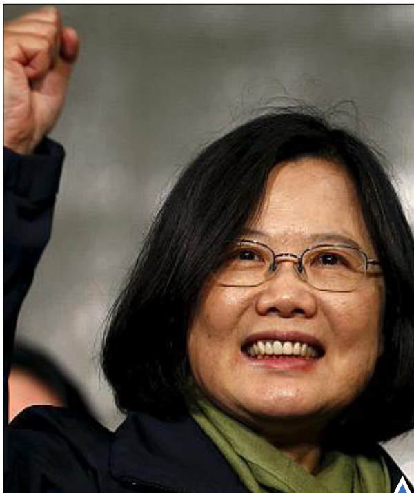
چهره «تسای اینگ ون»، از حزب «دموکراتیک مترقی» به عنوان نخستین رئیس جمهوری زن تایوان.

در جریان حمله مردان مسلح وابسته به القاعده به هتل محل اقامت کارکنان سازمان ملل و اتباع غربی در آواکادوگو، پایتخت بوریکنافاسو ۲۳ نفر کشته و ۱۵ تن دیگر زخمی شدند.