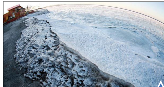
دریای منجمد شده در «دالیان» چین. تصویر هوایی از برف زمستانی در لیتوانی.