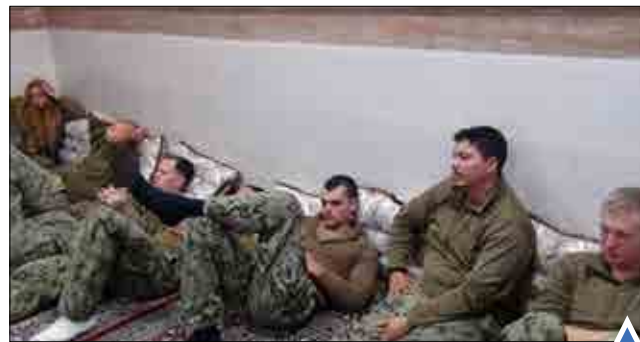
دستگیری تفنگداران آمریکایی توسط نیروی دریایی سپاه پاسداران.