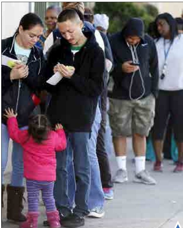
صف خرید بلیط ۵/۱ میلیاردی بخت آزمایی در لس آنجلس آمریکا!

راهبان معبد پوزانو در شهر گوانگژو چین در کنار جسد مومیایی شده فو هو راهب پیشین این معبد که ۳ سال پیش در سن ۹۴ سالگی درگذشته است.