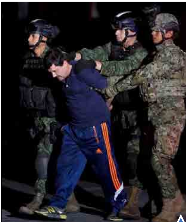
قاچاقچی بزرگ مکزیکی که پیش از این چند بار از زندان گریخته بود یک بار دیگر دستگیر شد.

تصویر یک آدم‌برفی کوچک در میدان «ژاندارمن مارکت» برلین، بعد از دو روز بارش برف سنگین.