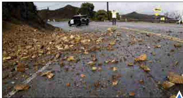
پدیده‌النینو موجب وقوع بارندگی‌های سیل‌آسا در کالیفرنیا ی آمریکا شده است.