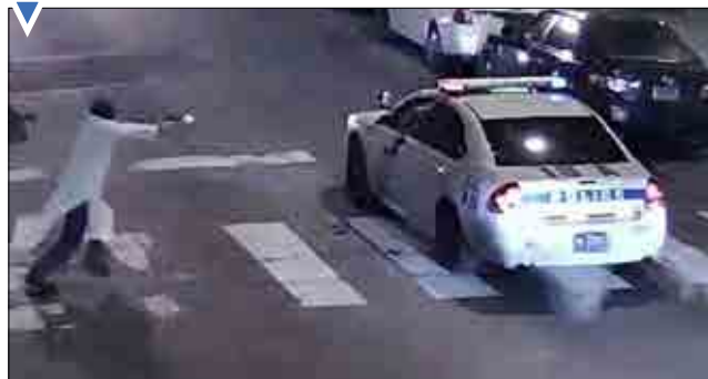
حمله هوادار داعش به مامور پلیس آمریکا.