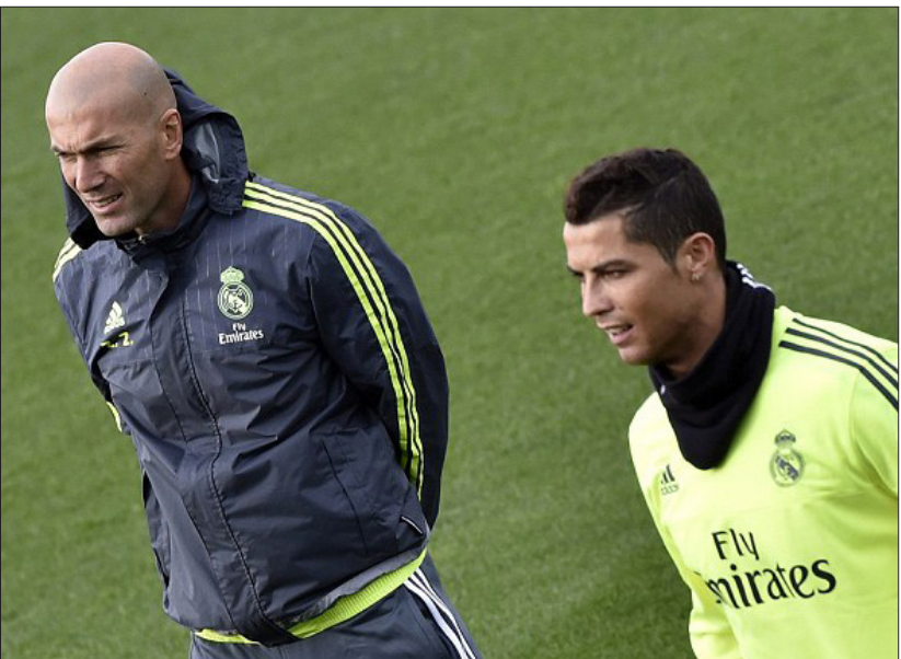
همه امشب منتظر اولین نمایش رسمی زنال با زینو هستند.