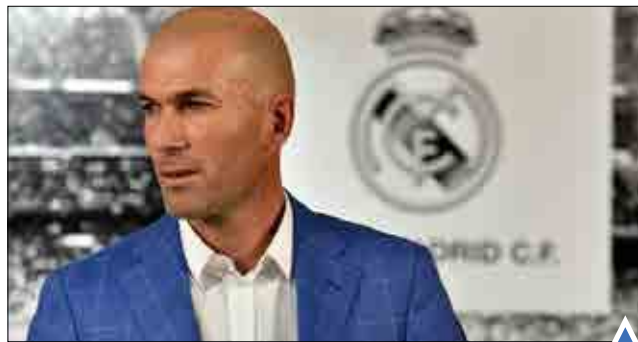
انتصاب زین الدین زیدان به عنوان سرمربی جدید تیم رئال مادرید. نصب مجسمه غول پیکر رهبر چین در استان هنان.