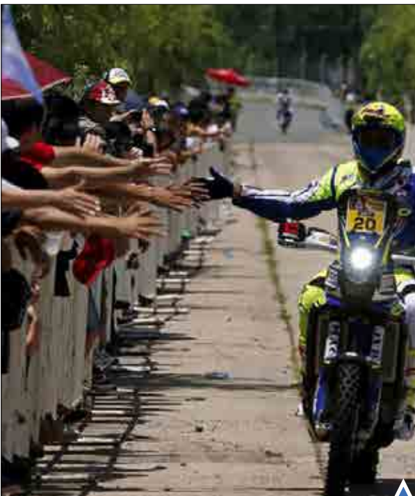
مسابقات رالی داکار ۲۰۱۶ این روزها در کشور آرژانتین در حال برگزاری است.

زلزله ای ۶٫۷ ریشتری در مناطق دور افتاده شمال شرق هند موجب مرگ دست کم ۸ تن و زخمی شدن بیش از ۱۰۰ نفر شد.