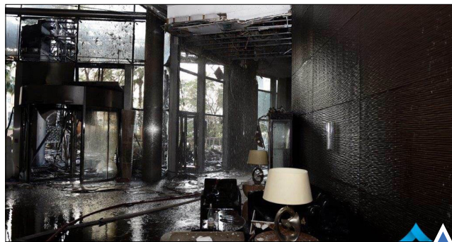
آتش سوزی در هتل ۶۳ طبقه دویبی در ورزش صبحگاهی ورزش در دمای منهای آغاز سال نو میلادی.