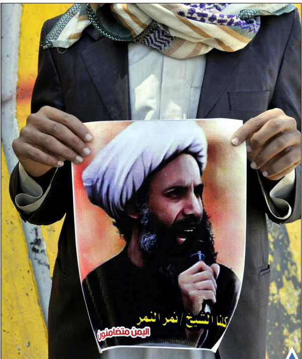
شیخ نمر باقر النمر، روحانی شیعه مخالف حکومت عربستان سعودی، اعدام شد.

در نتیجه تیراندازی در یک کافه در شهر تل آویو، مرکز این رژیم، دست کم دو نفر اسرائیلی کشته شدند.